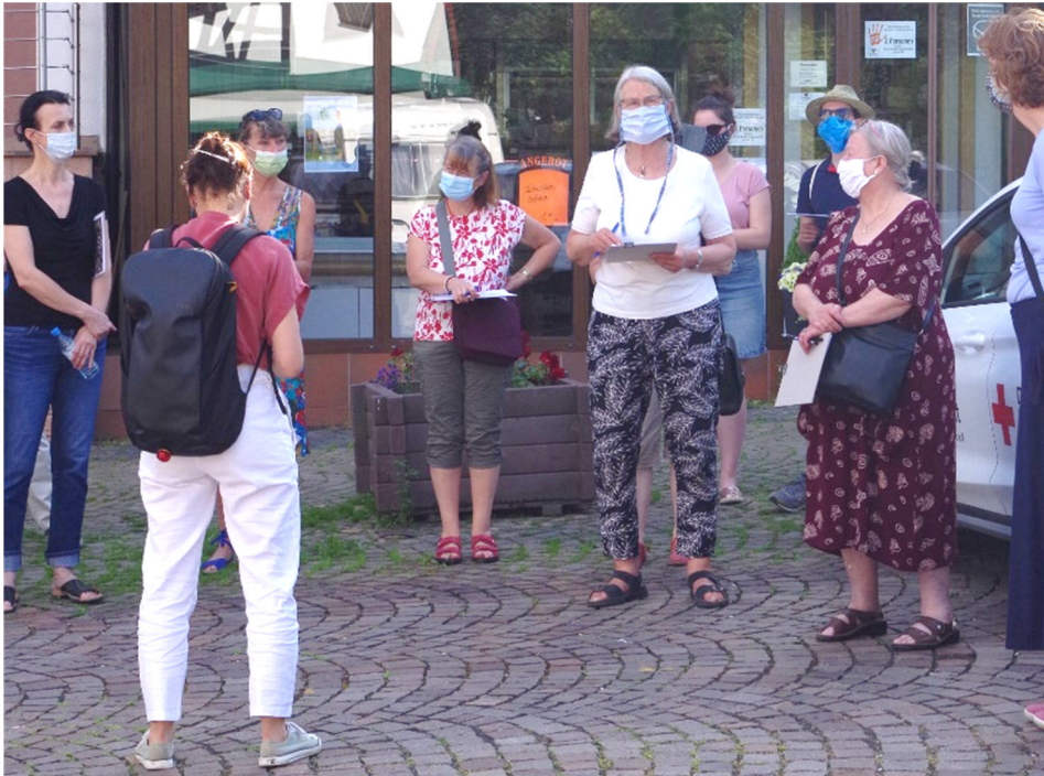
Abbildung 4: Diskussionen über Vorstellungen des zukünftigen Marktplatz