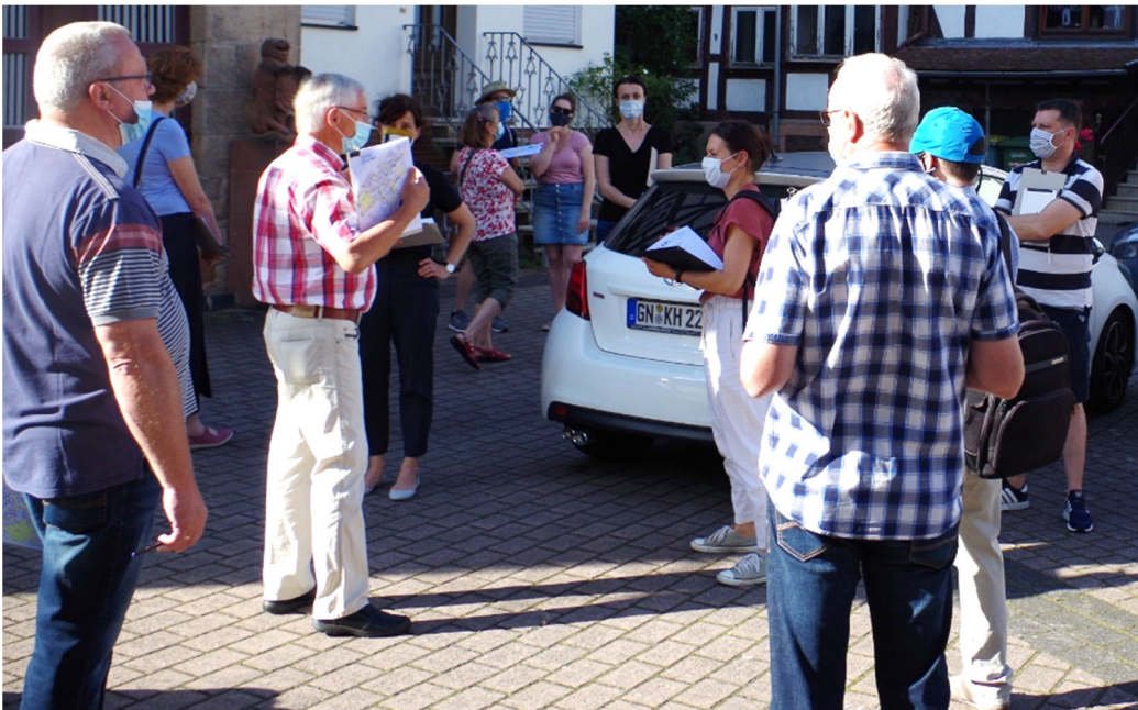
Abbildung 5: Diskussionen über die Vorstellungen des Platzes im Untertor