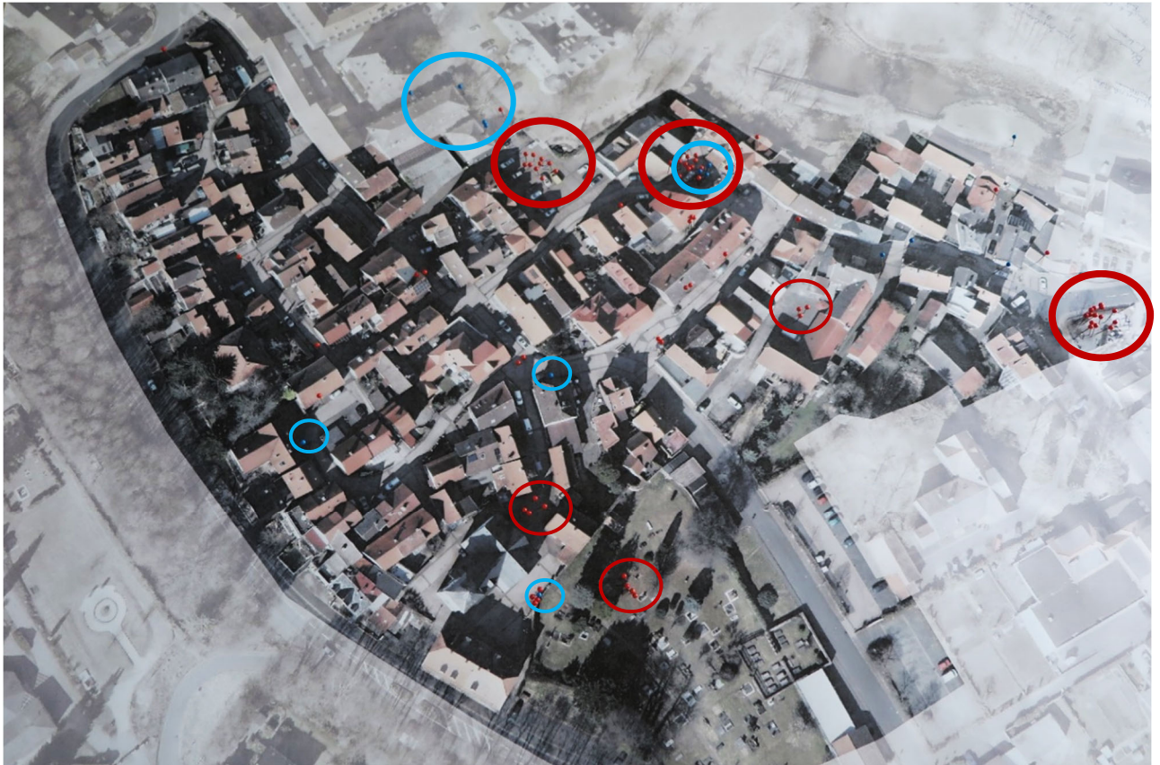
Abbildung 1: Verortung von Aufenthaltsbereichen (rot) sowie positiven Details in der Altstadt (blau)

Zusätzlich sollten die Teilnehmer im Stadtraum der Altstadt verorten, an welchem Detail Sie sich im Vorbeigehen in der Altstadt erfreuen. Genannt wurden einzelne Sitzmöglichkeiten (Bänke), schöne Fassaden (Prinzessinnenhaus, Heimatmuseum, Schloss, Marstall) und einzelne Bäume (Kastanie vorm Marstall) bzw. Bepflanzungen in Vorgärten. Auf dem Spazierweg rückten die Blumengirlanden an den Straßenlaternen in den Fokus: diese wurden als schönes Detail empfunden, welches aber leider nicht durchgängig an allen Laternen angebracht ist.