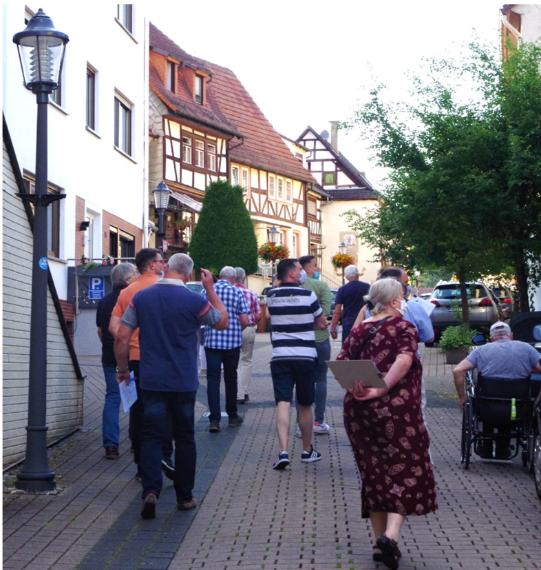
Abbildung 7: Wahrnehmung des Obertors als Aufenthaltsraum