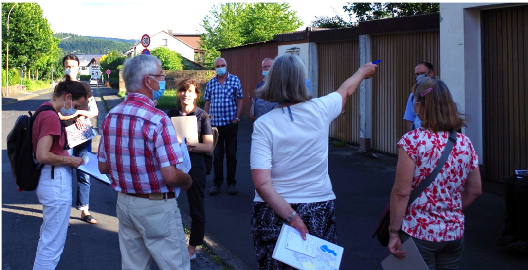
Abbildung 6: Überlegungen zur Verbesserung der Parkplatzsituation