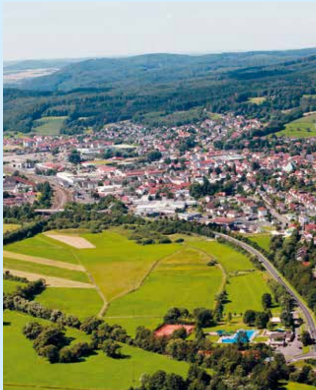
Ansicht von Wächtersbach mit Schwimmbad

Weitere Informationen, auch zu Heimatmuseum und Stadtführungen: